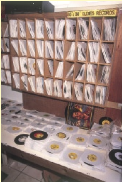
ズラッと並んでいる7インチのレコード。どれを買ったらいいのか迷ってしまう