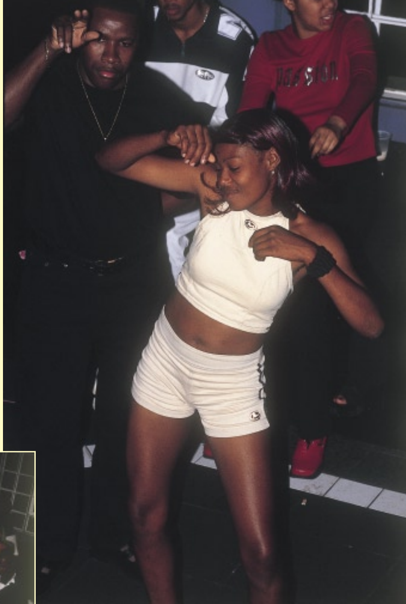
ナイトクラブには、ファッション・モデル顔負けの女性も来ていた