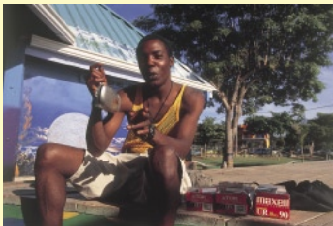
ビーチにあるカフェ・バーでくつろいでいると、DJがカセット・テープを売りに来た