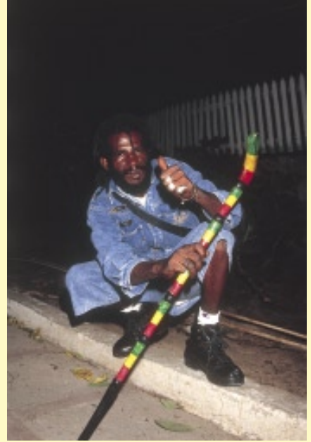
ジャー・エチオピアは、「自分の写真も撮ってくれる？」と言って話しかけてきた