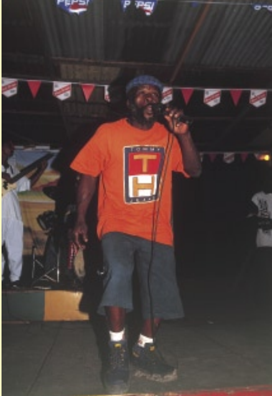
ラスタハアーのリトル・アナナは、モンテゴ・ベイで最も人気のあるミュージシャンだ