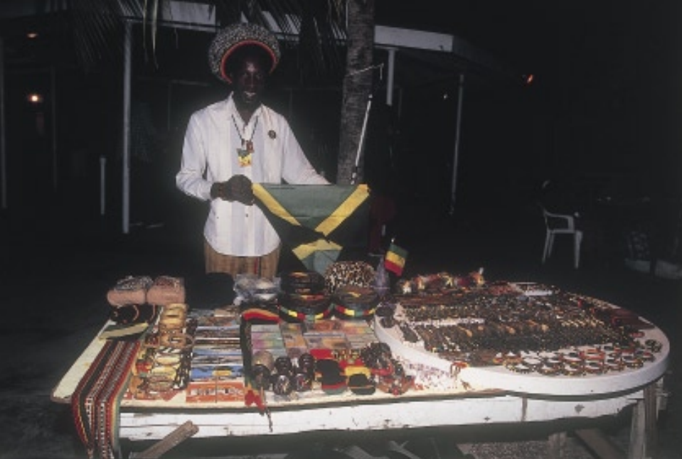
観光客を相手にラスタカラー（黒、赤、緑、金（黄）の4色を指す）のアクセサリーを売っているラスタマンもいた