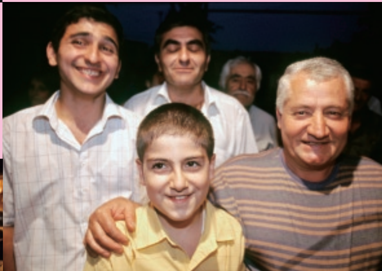
結婚式の日に出会った家族の男性達