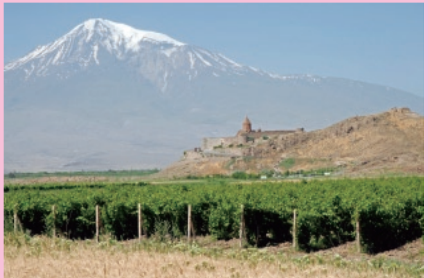
アララト山とカール・ヴィラバ修道院（イェレヴァンから30km行った所）

が存在するのはソヴェエト連邦崩壊の渦中の一九九一年以来のことである。 虐殺や紛争を逃れたアルメニア人達の帰郷の地である首都イェレヴァンは、厳かにそびえるアララト山の広い裾野にある。創世記の中で、ノアの箱舟が大水の末に漂着した岸とはこの山で、アルメニアの人々にとっては聖地と言えるだろう。とはいえ人々の崇めて止まないこの山は標高五一六五メートルの高さから街を冷やかに見下ろすのみで、彼らがその万年雪を踏み締めることはない。アララト山は一九二〇年二月の条約以来、トルコに属しているからだ。 街の歴史は国自身と同様、再生の歴史と言える。紀元前八世紀創設のイェレヴァンは、インドとコーカサス地方の間を行き来する商人の交易地点として発展し、ペルシア人、ローマ人、アラブ人、モンゴル人、トルコ人、ロシア人とその支配者を変えてきた。一六から一七世紀にかけてのオスマン帝国とサファヴィー朝ペルシア間の戦時期には、双方の権力間にあつて帰属が変わった。この運命の揺さぶりに追い討ちをかけるかのように一六七九年六月、大地震が国を襲い、街は根元から破壊された。一九世紀後半以降、それまでティフリス（現グルジア首都トウビリシの旧名）やアレクサンドロポリ（現ギュムリ）などの街とさして変わらない規模だったイェレヴァンは一都市として、まもなく首都として変化を遂げていく。