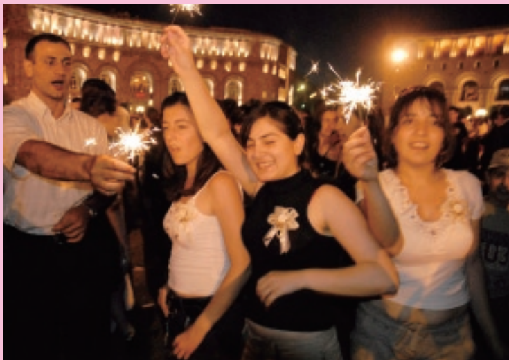
イエレヴァン「リパブリック広場」で行われたコンサートにて

ソ連崩壊の瓦礫の中で、アルメニアの経済はすぐにマフィアのコントロール下に置かれ、それによって瞬く間に財を得た権力者達が国の主たる経済活動を仕切るようになったが、街の再生復興において重要な鍵を握るもう一つの勢力はディアスポラである。八五〇万人のアルメニア人のうち国内在住は三五〇万人を下回り、移住先で共同体が形成された国は世界中で五〇を上回る。国内の不安定な情勢に疲れ果て、トランスコーカサス地方の激烈な地政に絶望し、この数十年だけでも一〇〇万人近くが国を去った。彼らディアスポラにとっては伝説となった祖国とその首都に対する思いは強く、そこへの投資は惜しまない。