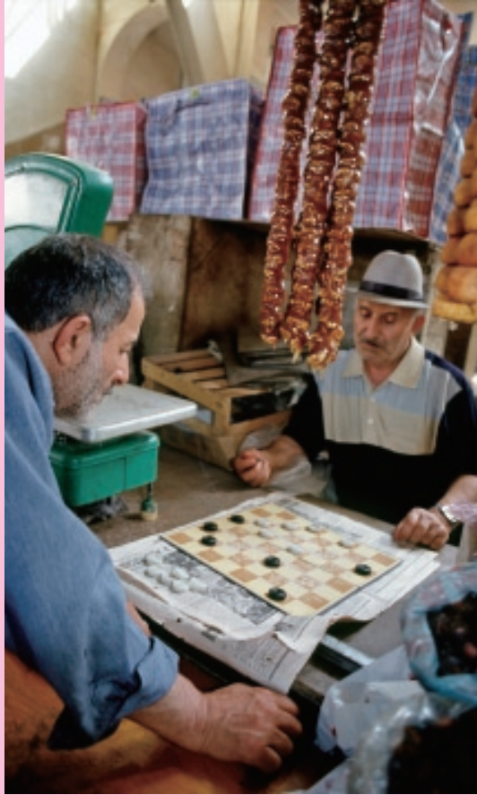
市場にて、ナルディ（さいころを振って駒を動かす、すごろくに似た遊び）を楽しむ商人達