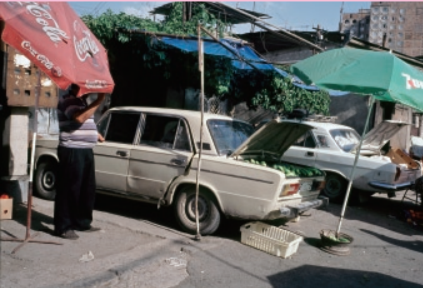
果物や野菜を扱う市場にて