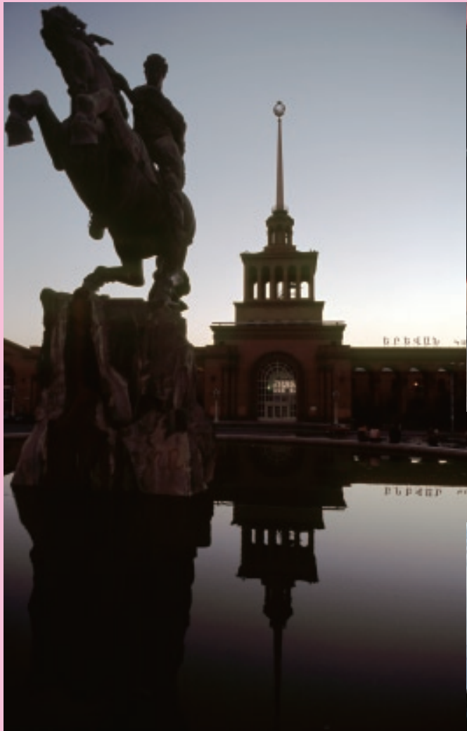
旧中央駅前の記念碑