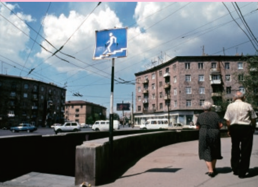
街の中心の地下鉄の入り口

一九一八年五月、アルメニア独立共和国が初めて成立し首都と制定されるが、その後ソ連邦に包括されたアルメニア・ソヴィエト社会主義共和国首都として存続、ようやく一九九一年、イエレヴァンは再度独立を果たしたアルメニア共和国の首都として新たな道を歩み始めた。 しかし独立後何年かは苦しい状態が続く。冬期、気温が零下二〇度まで下がることも珍しくないイエレヴァンで、戦争や経済混乱の中、人々はガスも電気も通らない暖房無しの生活を余儀なくされた。 今日このいたって無機質な印象の街を歩いていてまず驚くのは、なお色濃く残るソヴィエト連邦時代の強い影響である。重々しく立ち上がるバラ色の石造りの建築の中を、時代はずれの路面電車や車ががたがたと大揺れしながら走っており、連邦崩壊以来放置された巨大な工場、旧式の地下鉄、そこに立つ記念碑、公園などとも大いなるソヴィエト伝統様式を踏まえ、ロシア語も頻繁に使われている。 住民約一〇〇万人のイエレヴァンと、独立から一五年経った今でも成り行き任せに放置されているかのような国の他の地域との隔たりは著しい。国の富が一極集中するその首都はここ数年、街全体が埃にまみれた巨大で忙しない工事現場の様を呈している。歴史ある界隈がそっくり取り壊され、その跡に国外在住の新世代の成功者向けの現代建築が現れ始めたのだ。