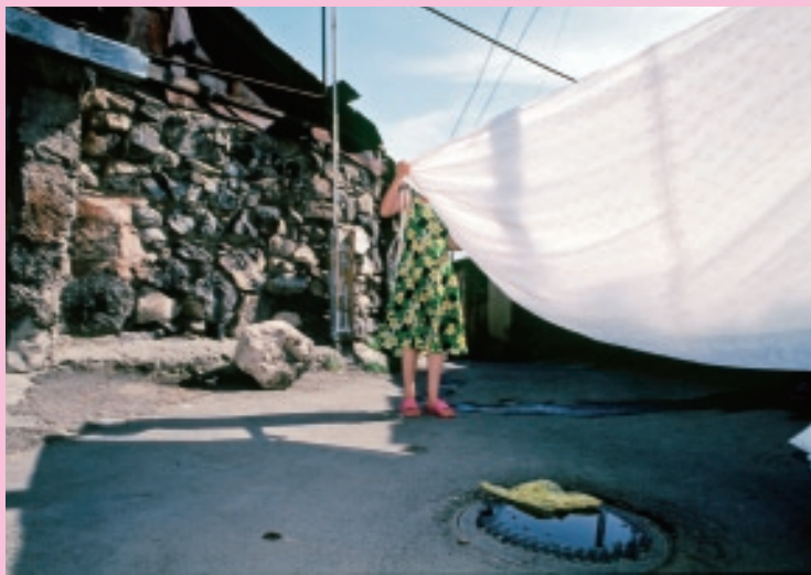
下町にて、若い女性が洗濯物を広げていた