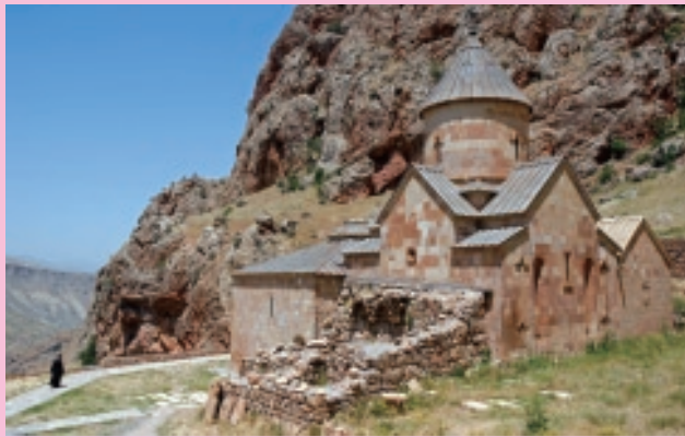
イェレヴァンの南、ノラヴァンク修道院（イェレヴァンから122km行った所）