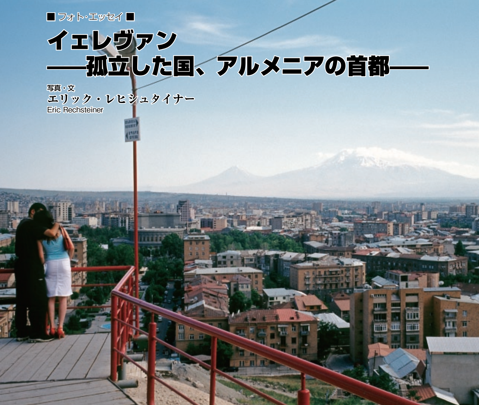
眼下に街、遠くにアララト山を望む丘の展望台でのカップル

黒海とカスピ海の上に位置するトランスコーカサス地方の小国アルメニア共和国。イエレヴァンはその首都である。国土面積二万九八〇〇平方キロのアルメニアは、往々にして対立関係にある周辺諸国の交差点にあつて、北はグルジア、東はアゼルバイジャン、南はイラン、そして西方はトルコと接しているが、現在アルメニアへの出入りはグルジアかイランとの国境に限られている。