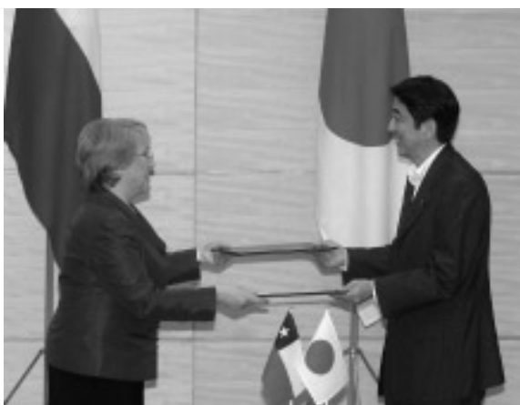
両国首脳による発効署名式