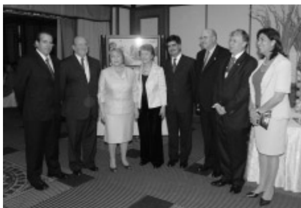
日本における輸出振興式典にて。右から3人目がオバージェ CPC 代表。 2007年9月4日