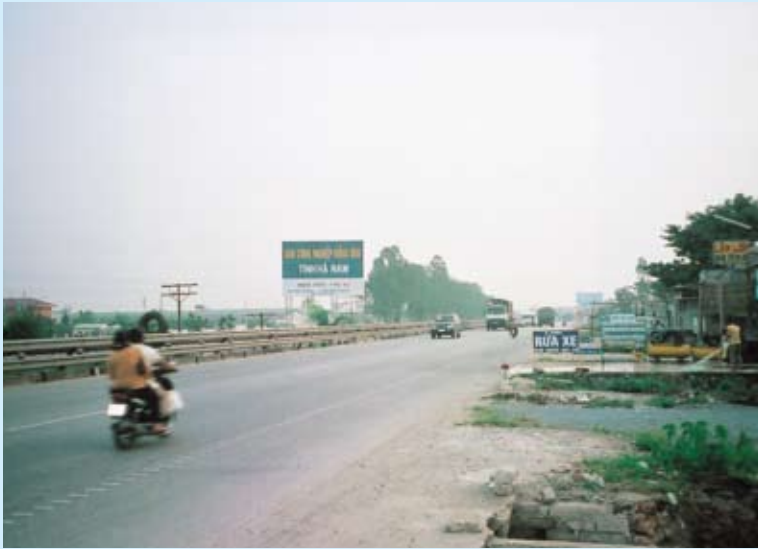
国道1A号線。交通量が非常に多い