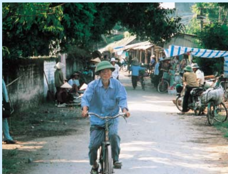
市場近くを通りがかった老人