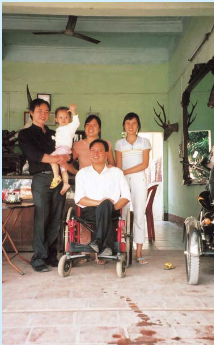
産声を上げつつある障害者活動のリーダー(中央)とご家族。同男性は「漢方」の専門家

宅であった。ご両親と妹の四人で暮らしているが、二カ月前にハノイに。同女性は今来手足に障害を持ち、また、心臓の手術を受けている。二日に一回隣省ハータイ省の病院で診療を受ける必要があるという。 K君は先日と同様、訪問先の椅子あるいはベッドに腰掛けてじっと黙っていた。 昼は卵の生産・売買を生業としている民家(三番目に訪問したお宅の親類宅)で過ごしそうになった。ご夫妻とおじいさんが家にいた。ご夫妻は大皿一杯に盛った「ゆで玉子」(若干雛に成長しなかったもの)や魚料理などでもてなしてくれた。 食後少し休みをとり、K君の家の側まで一緒に行った。 午後の調査を終えて宿に戻る途中、初めて出会った小道の脇にK君が立っていた。改めて御礼を言い笑顔で別れた。 ◇ ◇ ◇ 二〇〇七年一〇月、調査で中部北方地域に位置するタインホア省に向かった。ハノイからタインホア省に行くには国道1A号線を用いる。行きは車を借りたので前年の調査時にお世話になったハナム省の人たちに少しだけ挨拶できた。帰路は通りがかりのバスを拾いハノイへ。やがてハナム省に入り、車窓から外を注視する。 K君の暮らす村をバスは通りすぎた。 (てらもと みのもる／アジア経済研究所地域研究センター)