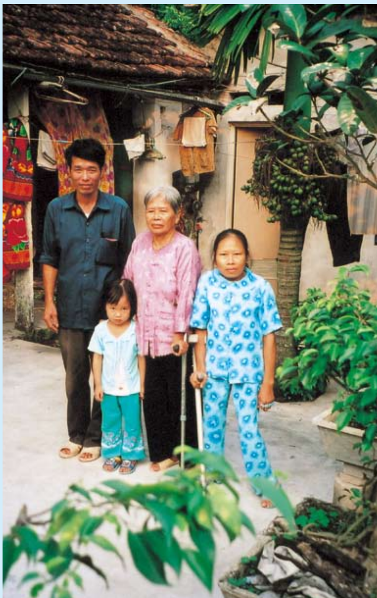
籐細工作りに取り組んでいる女性（右端）。母親（中央）らと