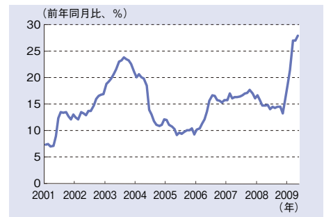
図2 中国の金融機関の貸出伸び率（前年比、%）