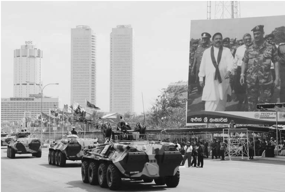
スリランカ内戦終結祝賀パレード。右上はマヒンダ・ラージャパクセ大統領とサラット・フォンセカ陸軍司令官