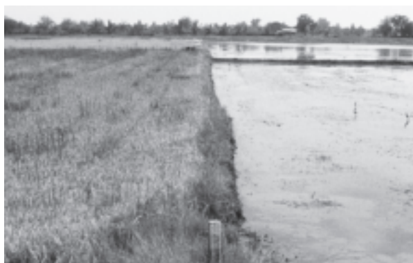
刈取り直前の水田と播種直前の水田が隣り合う (2009年5月、スパンブリー県にて)

く、農民の所得政策を目的として行われるようになった。米価について言うならば、高騰よりも下落時に政策介入をするようになった。そのうちもつとも多く使われたのは質入れプログラムである。このプログラムでは、農家が精米所等に籾を預けると、その代価を政府系金融機関から融資の形で受け取ることができる。もし価格が上向かなければ農民は預けた籾を「質流し」することで、受けた融資をそのまま籾の販売代金とすることができると。融資時の価格を政府が市価より高めに設定することで、農家への補助とするものである。二〇〇〇年代に入ると、質入れプログラムによる籾の買い付け量の比率は、総生産量の一〇数%から二〇%