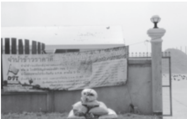
「質入れで良い価格。農民には確かな所得。」との横断幕を掲げる精米所（2009年5月、スパンブリー県にて筆者撮影）

そうなると収穫の時期になって価格が下落ないし低迷しようものならば、農家は黙っていない。タイでは