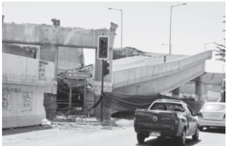
地震直後のサンティアゴの高速道路の様子

さらに事態が深刻であるのは、地震の震源地に近いコンセプシオン周辺、およびその後の津波に襲われた中南部の海岸沿岸の漁村である。特にマウレ州の漁村は、海岸山脈によつて中央平原と隔てられているために陸路交通の便も悪く、地方都市部とも隔絶されているところが多い。地震発生から二日経つても詳細