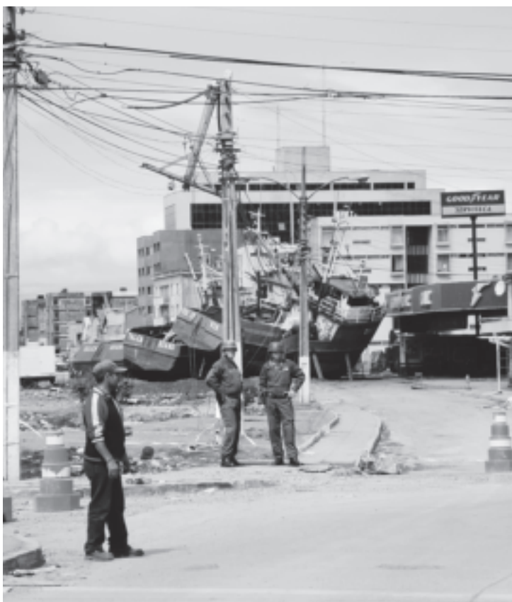
津波で漁船が打ちあげられたタルカウアーノ港

チリ地震は、揺れ自体も大きくこれによる人的物的被害は甚大であつた。しかしこれに加えて、その後の同胞による略奪行為を目の当たりにしたチリ社会に与えた影響もまた大きかったといえる。今年二月にはOECD加盟も決まり、これから先進国の道を歩む発展した国という自画像は、もろくも崩れ去つたよう