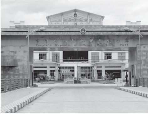
中国雲南省普洱市に設置された孟連国境ゲート。写真の 手前側はUWSAが実効支配するワ州の州都・邦康。 (2009年7月29日)

表2のうちミャンマー政府の直轄地域に設置されている国境ゲートは、瑞麗と畹町のみである。これら二カ所の国境ゲートを通過した貨物は、ミャンマー側ではいずれも国境の町ムセやチューコックから十数キロ離れたムセ（一〇五マイル）の国境貿易拠点で検査を受け、輸出入の手続きが行われている。一方、ルウエジェー（中国側は章鳳）はカチン独立軍（KIA）、チンシュエホー（中国側は清水河）はコーカン軍（MNDA）の支配地域に設置された国境ゲートではあるが、実態としてミャンマー政府の影響力が強く働くため、正式な国境ゲートとして位置づけられているものと考えられる。すなわち、これら三カ所（中