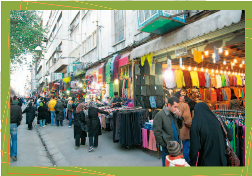
テヘラン下町、マヌーチェフリー通り近くの服飾バーザールにて。 2008年11月の休日（金曜日）の午後。