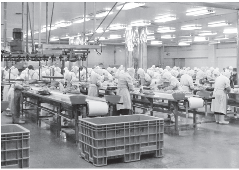
吉林省の大手鶏肉加工企業。近年の人手不足を受け、この企業でもワーカーの賃金引き上げが著しい。

トライキは拡大をみせたが、六月一日に従業員の賃金を三五%引き上げること、ストライキに参加した従業員の責任追及をしないこととで合意した。この事件をひとつの契機にストライキが各地に広がり、トヨタ自動車の広州工場や系列の天津工場などでもストが発生した。