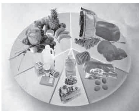
基礎食品群の写真

●HIV／エイズ対策インフラ(保健システム)を使った栄養改善 人々の行動(practice)変容には、正しい知識(knowledge)のみならず適切な態度・考え方(attitude)