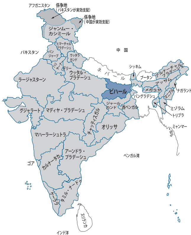
図1 インド概略地図

州の四倍のペースで経済成長する必要があることを示唆している。したがって、ビハール州は経済開発や人間開発の面で他の州に大きく後れを取っているだけでなく、絶対的貧困の削減や経済的不平等の緩和といった面でも著しく不利な状況に置かれているのである。そのため、近年になってビハール州は国際機関や各国の援助機関から大きな注目を集めるようになってきている（参考文献③）。 では、ビハール州に見られる著しい後進性をどのように理解する