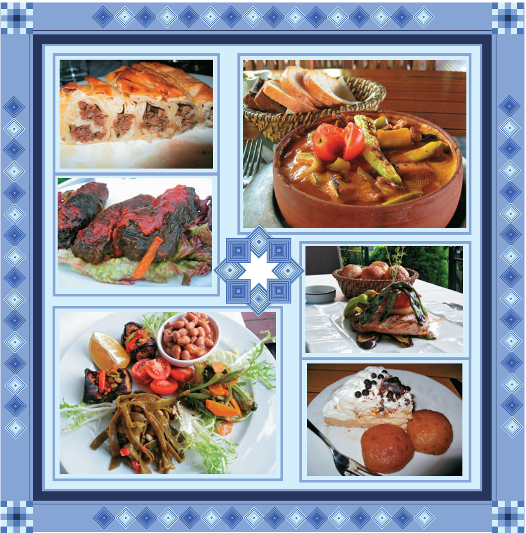
トルコ料理いろいろ。