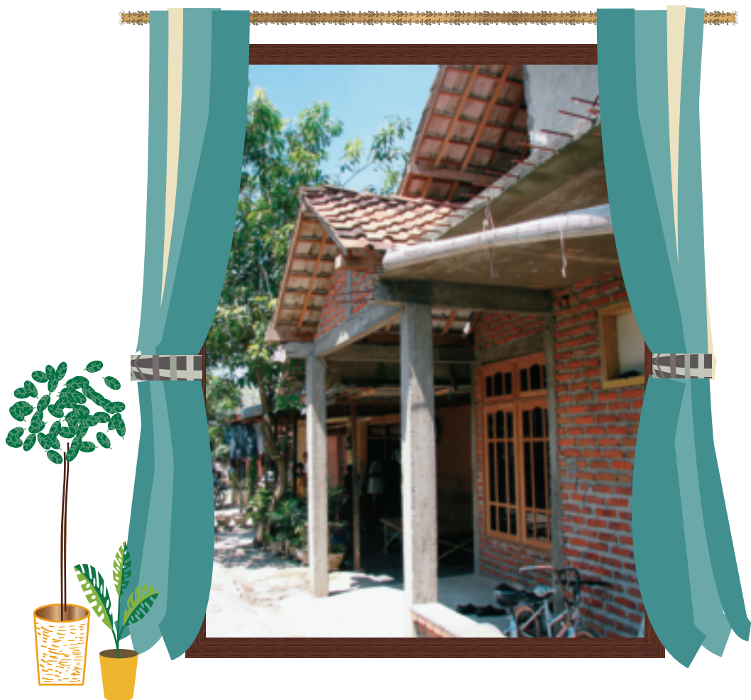
東ジャワ・グレシクの民家。