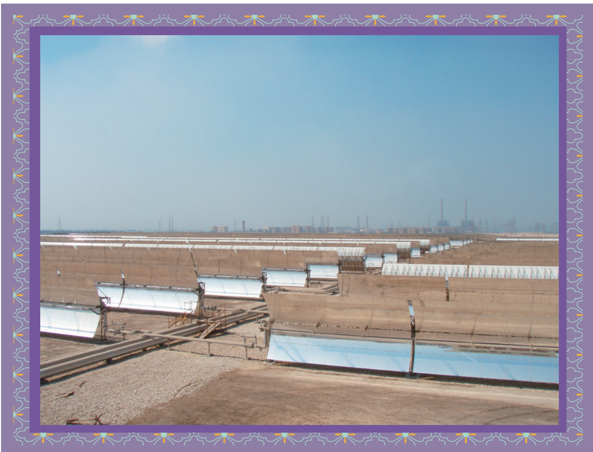
エジプトの太陽熱発電施設。