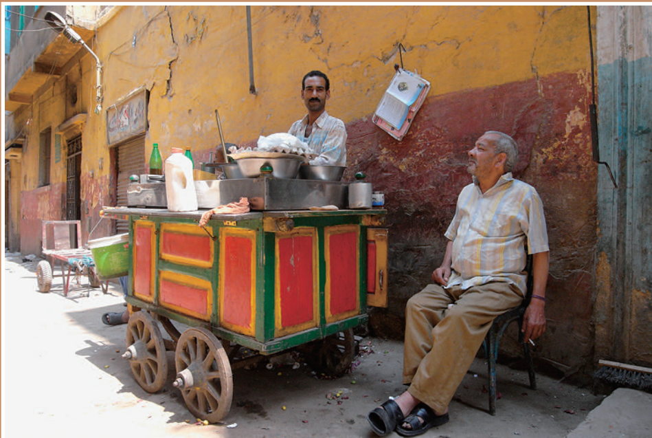
カイロの裏通りで、2011年6月。