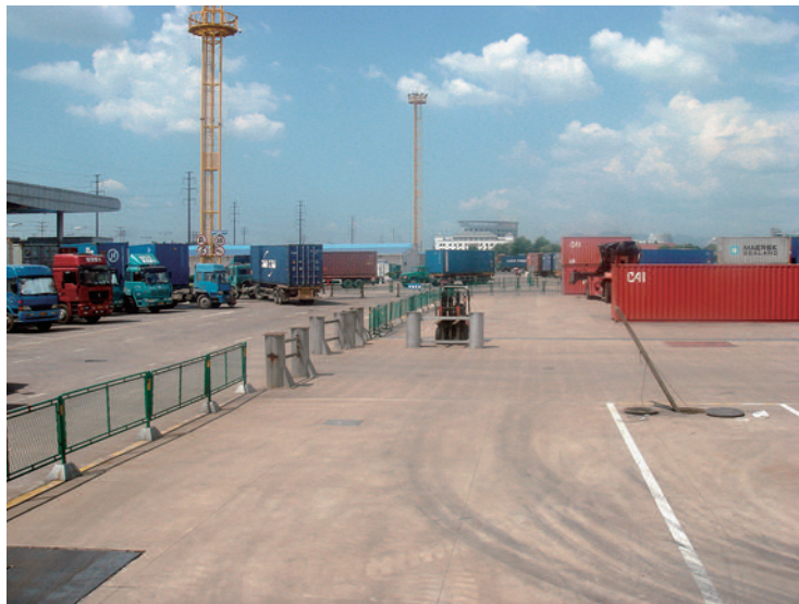
義烏税関の検査場で貨物検査の順番を待つコンテナトラックの列(上)。 義烏税関の検査場に入入りするトラック(下)。