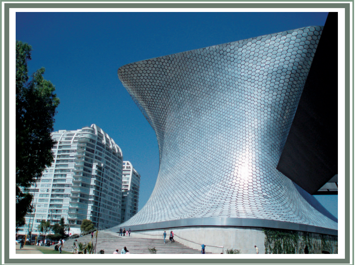
新ソウマヤ美術館。本誌22ページ「特集 メキシコのカルロス・スリム—大富豪の社会貢献—」より