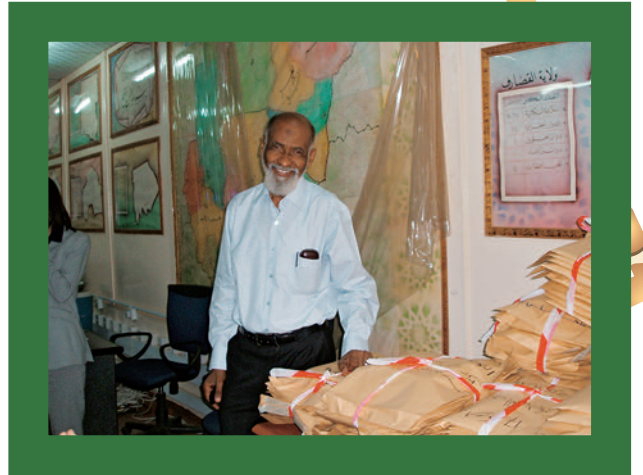
上:スーダン、ハルツームの投票所周辺の光景 (2010年4月の大統領選・総選挙に際して) 下:スーダン、ハルツームの選挙管理委員会事務所(同) 本誌「特集:南北スーダンの行方」(p.22)より