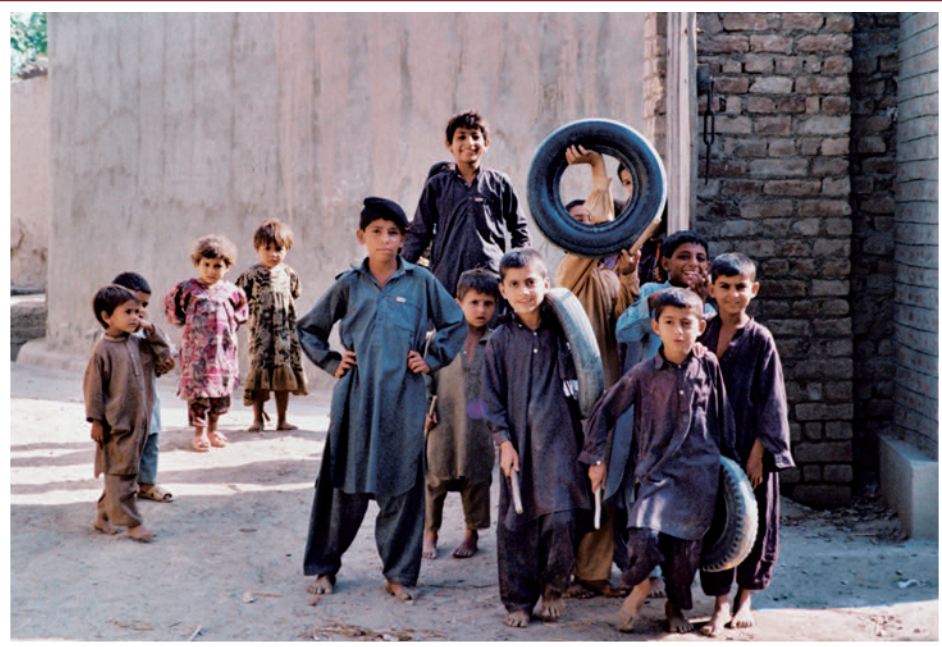
北西辺境州の農村の子供たち(1999年9月)