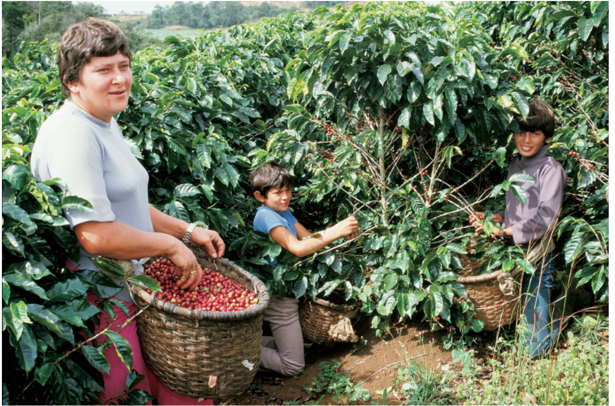
コーヒー豆を親子で摘む。サンホセ市より北西へ向かい太平洋と高地の分かれ目にある地方の個人農家での農作業