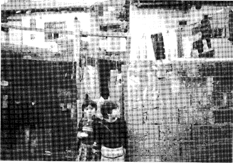
アンカラ：調査地区のやや貧しい地域で