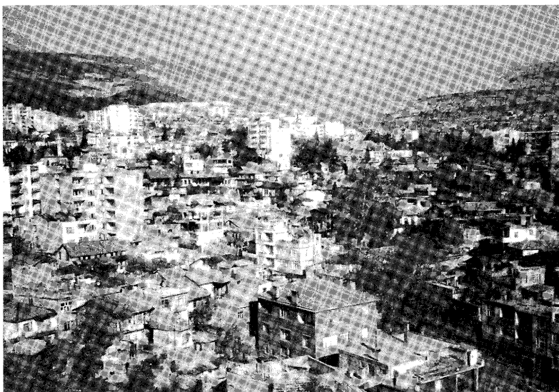
ガジアンテップ市街の遠景