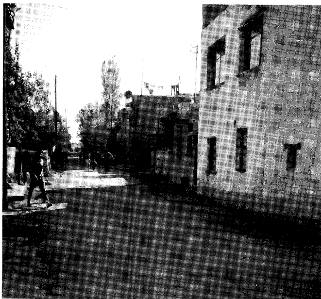
メルシン・・準中心地区シテラル地区の住宅地