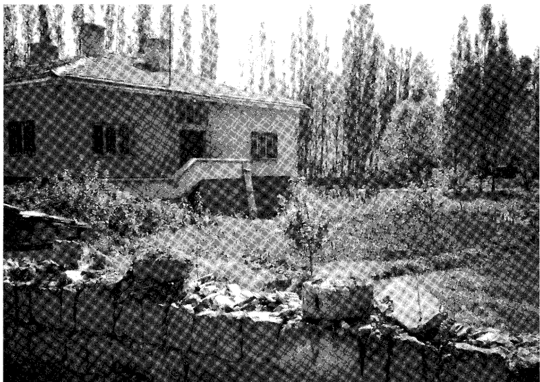
ビュンヤン：郊外（富裕）地区における住宅