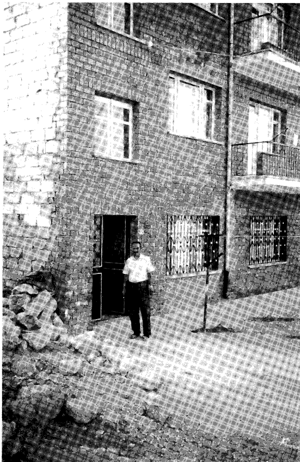
ネブシェヒル：調査地区でも国際移住労働者の多い新興地域