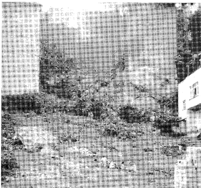
トラブゾン・・中心地区ザファール地区で この壁の向こうが「中城」の壁