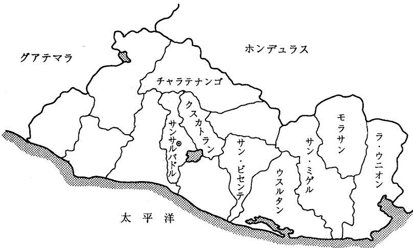
第2図 エルサルバドル FMLNの活動の盛んな県

1979年10月のクーデターでロメロ政権は倒される。同年7月に隣国ニカラグアで革命が成功してサンディニスタ政権が成立したが、ニカラグア革命がエルサルバドルに波及するのを恐れた軍内部の改革派がとった措置がこのクーデターであった。そしてキリスト教民主党のドウアルテ (José Napoleón Duarte, 後の大統領) を首班とする軍民評議会政権が成立した。当初評議会政