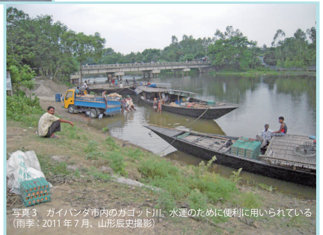
写真3 ガイバンダ市内のガゴット川。水運のために便利に用いられている（雨季：2011年7月）