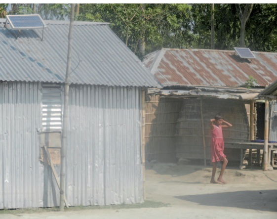
写真 11 NGO の支援によって導入された太陽光パネル (2013 年、アブー・シヨンチョイ撮影)