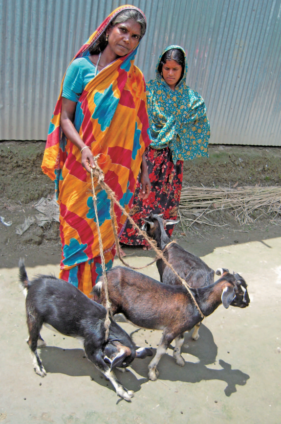
写真 10 ガイバンダ県やクリグラム県を中心に活動する NGO の GUK (Gana Unnayan Kendra: 大衆開発センター) が実施している、家畜移転プログラムの一環で与えられたヤギ (2012 年)