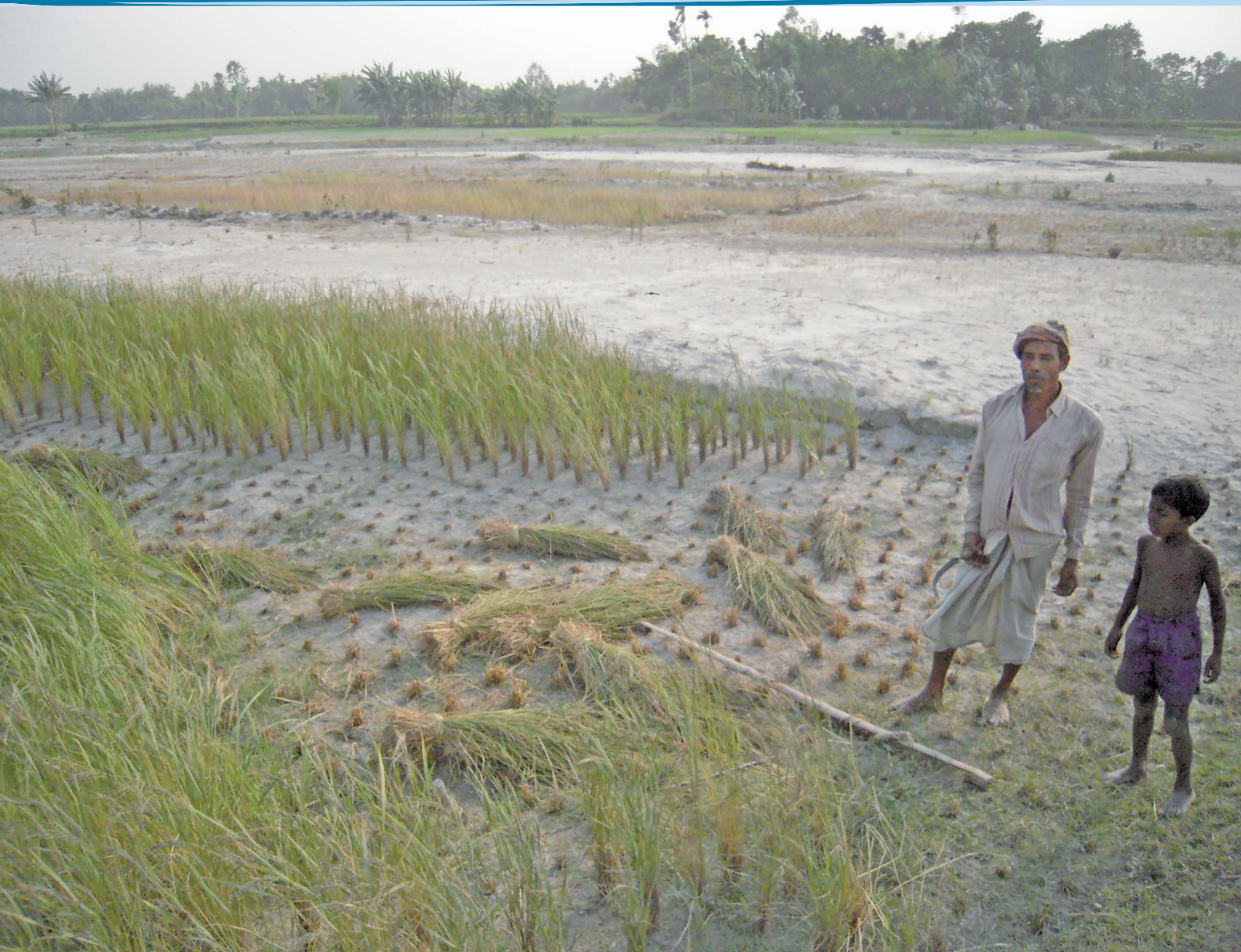
写真1 雨季には川底に沈む河川敷で、雨季直前に稲の刈り取りをする農民。所有権の確立されていない土地なので、貧困層が移り住んで、乾季の間に農業を行っている（ガイバンダ県シュンドルゴンジ村。2011年4月山形辰史撮影）