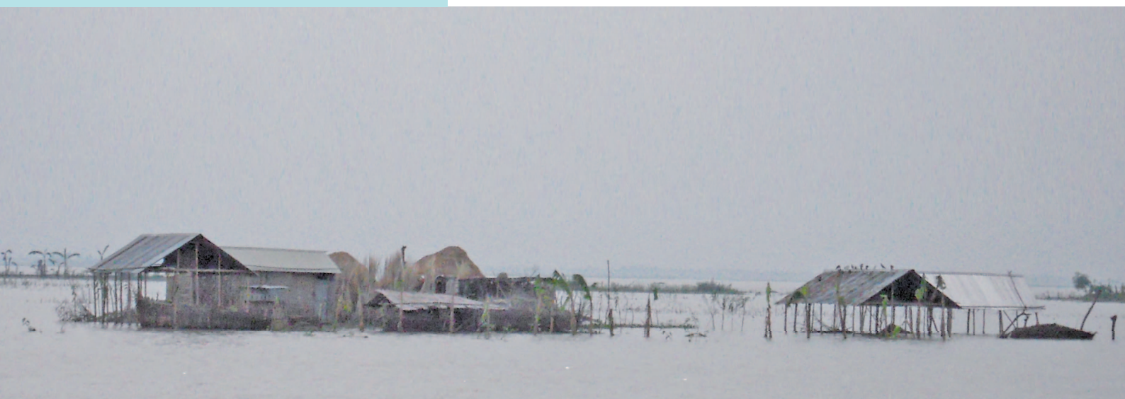
写真8 完全に水に浸かった家屋 (2011 年)

まった、マイクロファイナンスのパイオニアであるグラミン銀行や、マイクロファイナンスの規模では国内最大といわれる NGO の BRAC (バングラデシュ農村向上委員会) でさえ、活発に活動してはいない。というのは、これらの非営利団体が提供するマイクロファイナンスのやり方が、この地域の実状にあっていないからである。 例えば初期のグラミン銀行のマイクロファイナンスは、借り手が毎週欠かさずミーティングに出席し、その場で利子を返済することを原則としていた。このような原則は、洪水で何カ月か水没するような地域では適用できない。つまりこの地域は、バングラデシュの非営利団体にとってさえ、展開が困難な場所なのである。