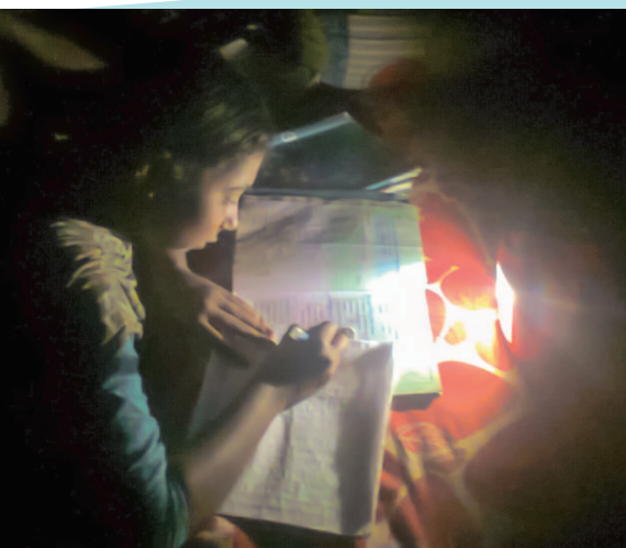
写真 12 日中、太陽光パネルによって蓄えた電気を使って夜に勉強する児童 (2014 年、GUK・アジア経済研究所調査チーム撮影)

それらは割高であるとか、煤煙の影響による呼吸器疾患を起こしやすい、といった問題を抱えている。安価で安全な太陽光電気を利用することで、家計負担の軽減や健康改善に加えて、子どもたちが夜でも電気の下で勉強することができるようになるなどの効果が期待されている (写真 11、12)。