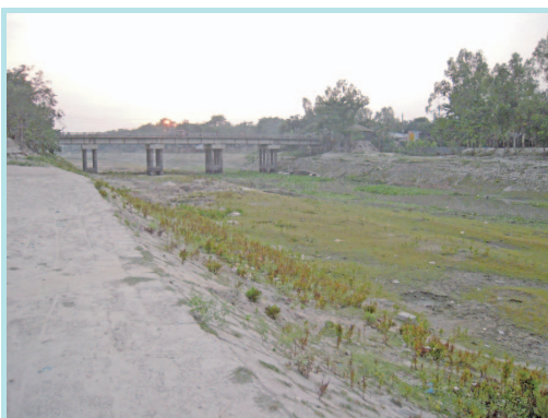
写真4 写真3と同じ場所から撮影した、雨季直前のガゴット川。水が完全に引いて、川底が現れている（2011年4月）