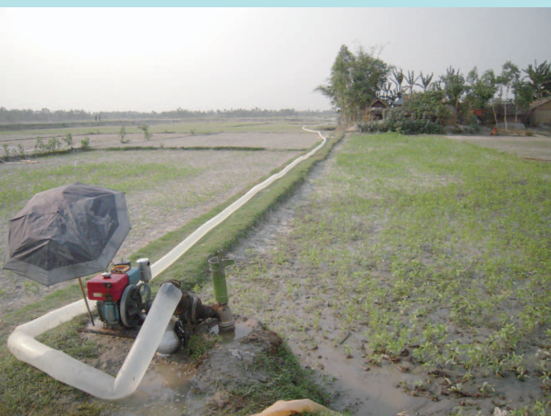
写真7 乾季に利用可能となった河川敷を灌漑して稲作をする。写真は揚水ポンプから蛇のように長く伸びたホース (2011 年)