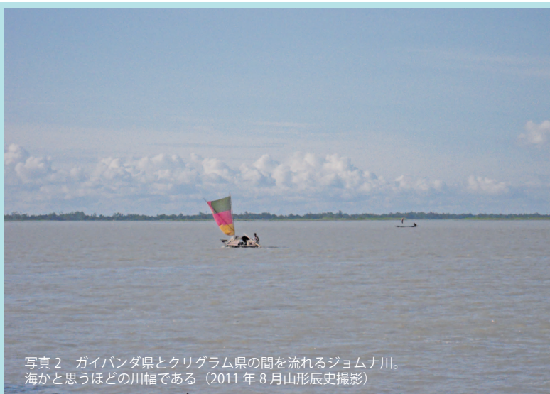
写真2 ガイバンダ県とクリグラム県の間を流れるジョムナ川。海かと思うほどの川幅である（2011年8月山形辰史撮影）

ガイバンダ県やクリグラム県といった洪水多発地域では、バングラデシュで生まれて世界中に広