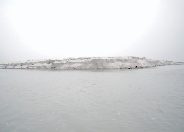
写真5 小さい Chol (中州) (2011 年)