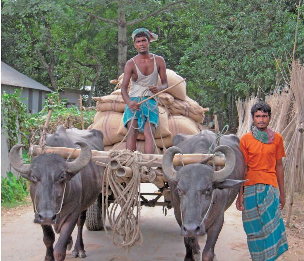
写真 9 洪水の被害を受けた住民のため、チヨルに届いた食糧援助の米 (2012 年)