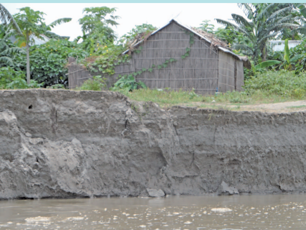
写真6 ジョムナ川の氾濫によって浸食された土地。もうちょっと浸食が進むと、この家も流されてしまう。(2012 年、アブー・シヨンチョイ撮影)