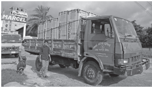
ウォルトンの冷蔵庫の出荷（2012年8月）

Bangladesh は堅実な経済成長を続けており、それにもないかつては一般庶民の手が届かなかった、冷蔵庫や洗濯機、エアコンといった家電製品や、携帯電話やパソコンといったIT機器の需要が高まっている。このような需要増に対して、地場資本が即座に国内生産で応えることは通常無理なので、この需要増に輸入増で対応することとなる。 Bangladesh の場合には、Rangs Electronics、Electro Mart、Butterfly Marketing、Singer Bangladesh、MyOne Electronics Industries といった企業が電気機器の輸入販売を行っている。例えば Rangs はソニー、Electro Mart は中国ブランドの康佳や格力、Butterfly は韓国のLGの製品を販売している。