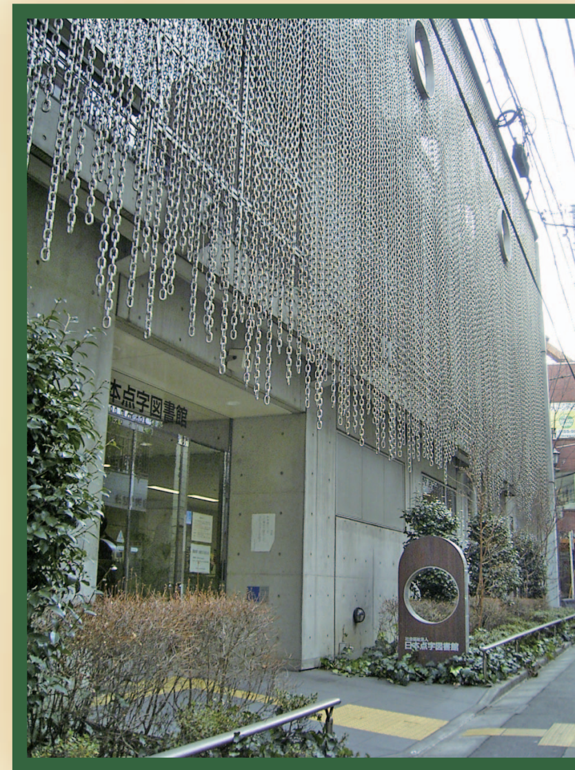
日本点字図書館正面玄関