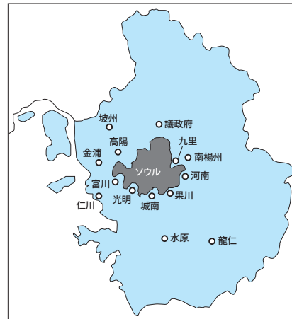
図1 ソウルと首都圏、主要衛星都市