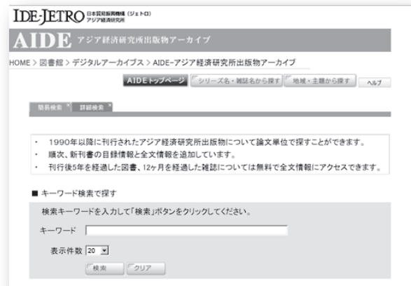
アジア経済研究所出版物アーカイブ検索画面

アジア経済研究所がこれまで刊行してきた開発途上地域の経済・政治・社会に関する学術情報をウェブ公開。論文単位で全文検索と閲覧ができます。刊行後、5年以内の出版物についてはアジ研賛助会法人会員のためのサービスとなりますが、アジ研図書館、ジェトロ・ビジネスライブラリー（東京、大阪）の来館者はすべて無料で閲覧できます。また、来館できない方は、章別単位で文献複写サービスをご利用いただけます。