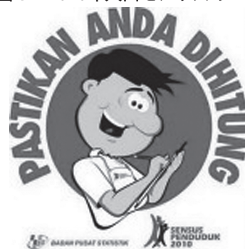
図1 2010年人口センサスのロゴ

(注) インドネシア語で「あなたもちゃんと入っていますか」とある。 (出所) 中央統計庁のウェブページより。