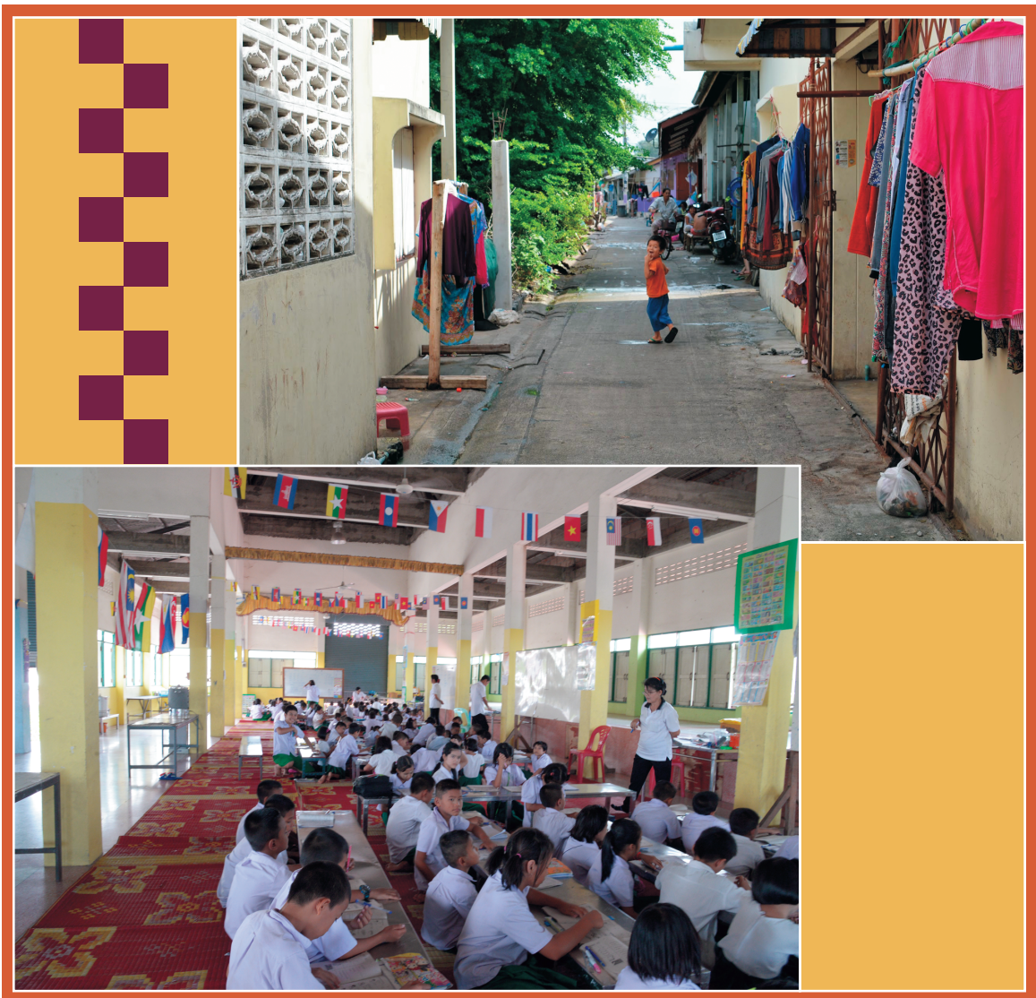
写真上：タイ・ラヨーンの移民労働者住宅(2014年10月) 写真下：タイ・マハーチャイのミャンマー人学校(2015年8月)