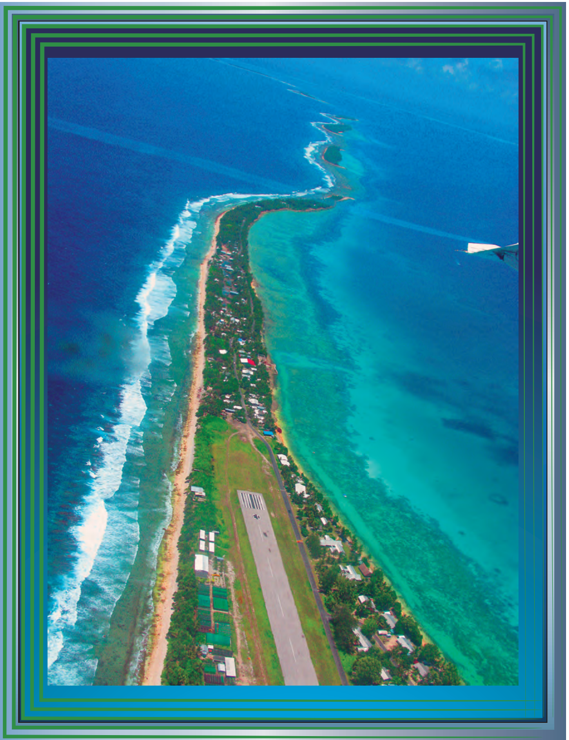
気候変動に脆弱な小島嶼国、上空からみたツバル・フナフティ環礁

本誌は「グリーン購入法」の判断基準に従い、再生紙を使用しております。 ISSN 1341-3406