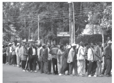
ナイロビの高級住宅街。投票を待つ有権者たち（2007年12月27日）

最悪の武力紛争が発生したのは、このキバキ大統領の再選が問われた二〇〇七年末の大統領選挙において、集計結果が発表された直後であった。ケニアの国会議員選挙区は全国（国土面積は日本の約一・五倍）を百数十〜数百に細分して設けられてきており、国会議員については選挙区のレベルで得票が集計された段階で当選者が事実上確定する。一方、大統領については全国一区であり、全国の投票結果をすべて集計し、得票数で一位、