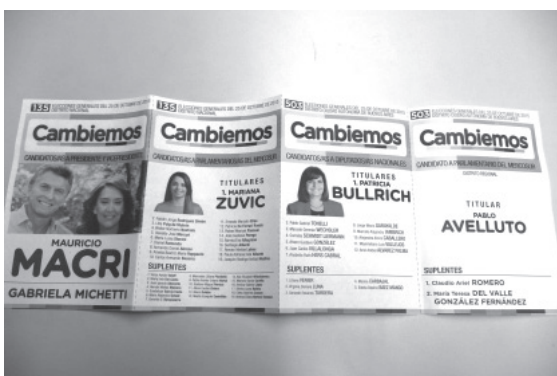
写真① 10月25日の選挙の投票用紙（見本）。政党連合「カンビエモス」の大統領および副大統領候補・メルコスール議会議員候補（全国区）・下院議員候補・メルコスール議会議員候補（地方区）が印刷されている

それでは、大統領選では政党A、下院選では政党Bに投票したいような場合は、どうすればよいのであろうか。そのような「分割投票」を英語では split-ticket voting と