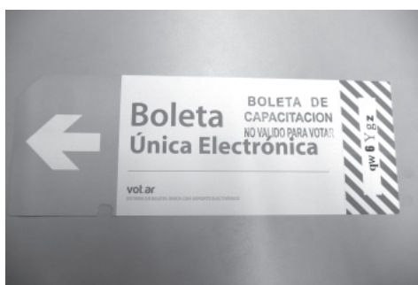
写真② 2015年のブエノスアイレス市地方選挙で使用された電子投票用紙の表面（見本）