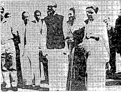
ラーマン首相と会見するガンディー首相