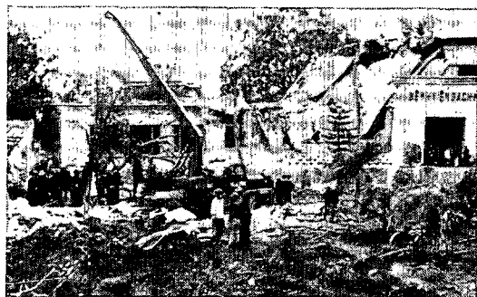
北爆で破壊されたハノイの病院

米ソ共同宣言でアメリカは国際管理下の停戦、捕虜釈放と引換えに4カ月以内に全軍を撤収する、政治問題はインドシナ人民自身の手によだねるとの見解を表明した。2月の米中共同宣言の段階では政治問題の解決を規定した8項目に言及していたが、ここでは撤退のみに触れ政治問題の解決については特に言及していない。これに対してソ連側はつぎのように述べている。「ソ連はベトナム問題を解決するための現実的で建設的なベトナム民主共和国と南ベトナム共和国の提案を断固支持しつつ、インドシナ人民が外部からの干渉なしに自らの運命を決定するようベトナム民主共和国に対する爆撃の停止、米軍およびその同盟軍の南ベトナムからの無条件完全撤退を要求する」。文章の後半において北爆の停止、米軍および同盟軍の南ベトナムからの無条件完全撤退を要求していることはアメリカの主張に合致している。注目すべきは前半の文章である。現実的で建設的な提案を支持するとあるが、北ベトナムも臨時革命政府もすでに7項目(1971年7月1日)、2項目(1972年2月3日)と政治解決についての提案を行なっている。米中共同宣言において中国はこの2提案に対する支持を明記しているのである。ソ連が上記のような表現を用いたことはこれら提案を現実的で建設的なものとは考えていないことを示し、今後ベトナム側に政治解決についての「現実的で建設