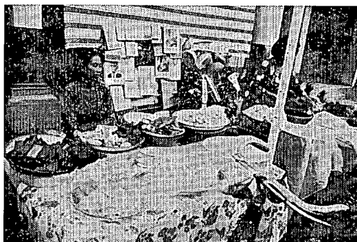
ジャカルタの露店商

外国資本投資は67年以来認可額で約30億ドルに達しているが、73年のディスバースメントは前年につづき製造工業を中心に活潑で、前年の3億4400万ドルを若干下回る水準に達すると予想され