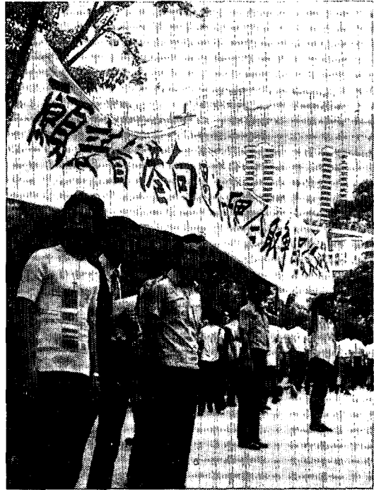
政庁下級書記労組は総督公邸へ初の賃上げ請願デモ

香港が本来的にもっている「政治的無色性」およびそれにバックアップされた国際中継地機能が再確認される一方では、原材料の供給難やコストアップから4～6割に及ぶ操短にみまわれ、商工業が衰退した。それは労働争議の頻発と長期ドロ沼化、家賃やレイト、公共料金値上げに反対する住民や経済団体の抗議行動、そうした社会不安を敏感に受けとめた学生運動の噴出の契機となった。こうした“内憂外患”は香港中国人の伝統的意識（拝金主義や短期的な見通し、大家族主義）に強い衝撃を与え、かつてなく、香港と我が身の“行く末”についても議論されることになった。それはすでに人口の6割を占めるにいたった戦後、香港生れの青少年層（主要統計第2表）に顕著である。香港が今では数少なくなった「植民地」のひとつであり、同時に高度に発達した「資本主義社会」であることからくる矛盾を彼等は真剣に取りあげるようになった。西欧資本主義の危機によって触発され、中国の国際社会における地位の高まりからくるこの新しくもまた古い問題提起は、現時点における苛烈な中ソ対決の焦点の地としても注目されるにいたった。以下各項目ごとに詳説す