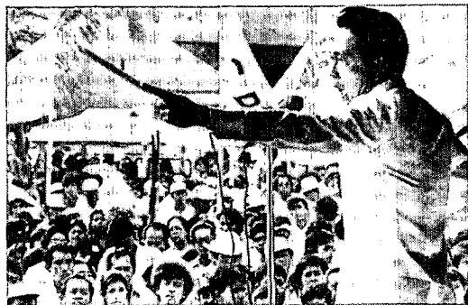
戒厳令7周年のマルコス大統領（9月21日）

しかし12月中旬マルコスは80年1月30日の地方選挙実施を急発表、関連法案の成立を急がせ