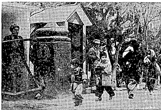
パキスタン・アフガニスタン国境のトルハム 検問所——向こうがアフガニスタン

密化するのを恐れていたがパキスタンが米の4億ドル援助を拒否するとこれを好感し、4月中旬、スワラン・シン元外相をパキスタンに派遣した。その頃、ジャ大統領はジンバブウェでガンディー・インド首相と会い、両国関係の緊密化で合意に達した。