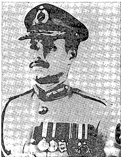
エルシャド戒厳令総司令官

視しており、軍の後盾がなければ、長くはもつまいとの読みをしていた。もちろん、BNP の内部対立があったりしたため、野党第1党のアワミ連盟 (BAL) の再台頭を許しかねないとの危機意識も強めていた。