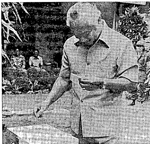
投票するスハルト大統領

MPR では第4次5カ年計画 (1984~88年度) の骨子である国策大綱 (GBHN) の採択が行なわれる。原案は、スダルモノ官房長官、スマルリン國務相、ムルディオノ内閣書記、ベニ・ムルダニ BAKIN 副長官ら政府要人11人から成るチームに