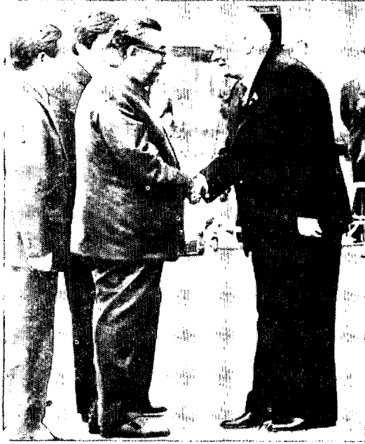
訪ソした金主席がチェルネンコ議長と握手