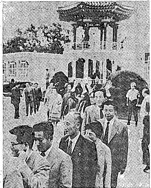
再会を終えて帰る北側訪問団(WWP)

1985年はさまざまなチャンネルを通じての南北対話が進行した年であった。2月に北朝鮮がチームスピリット85の実施に抗議して南北対話がとどえていたが、5月以降再開され、前述の故郷訪問団交換をはじめ、南北赤十字会談、あるいは経済会談、スポーツ会談、国会会談など各種会談が前年に引き続き行なわれた。これらの会談の多くは年内に実を結ぶことはなく、8月に平壤で開かれた南北赤十字会談（北朝鮮側が韓国側代表団に金日成主席礼賛のマスゲームを見せる）のような行き違いもあったが、おおむねなごやかな雰囲気のもとに行なわれ、対話のパイプを保ち、強化したという意味では評価されるべきであろう。