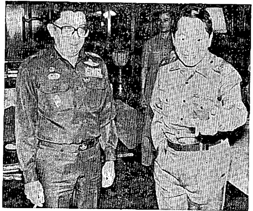
タイのチャワリット將軍(左)と懇談するソウマウン將軍(12月)

ネーウィンは、この時点ではまだ反体制運動は抑えることができると読んでいた。この読みは結果的に完全に裏目に出て、傷口を広げることになった。これまでのネーウィンの政治的慧眼からすれば信じ難い凡ミスであった。党大会冒頭の演説の3分の1を、アウンジー書簡に対する「言いわけ」に費やしたことから、ネーウィンのこの時点での狼狽ぶりが窺われる(1962年7月のラングーン大学構内ビルマ学生連盟本部への砲撃に関して、ア