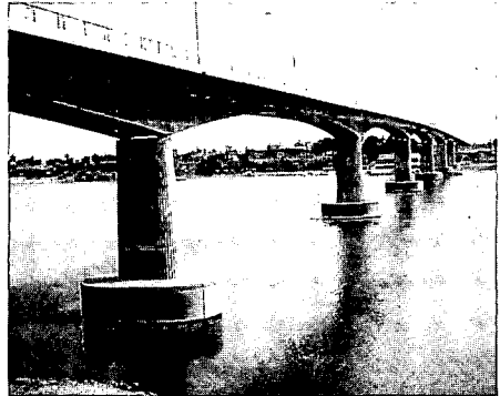
人影もまばらなラオス＝タイ友好橋

ス人は身分証明書さえ保持していれば、他の州へ旅行することができるようになった。4月には友好橋の開通が祝われ、ラオスとタイは陸続きとなった。