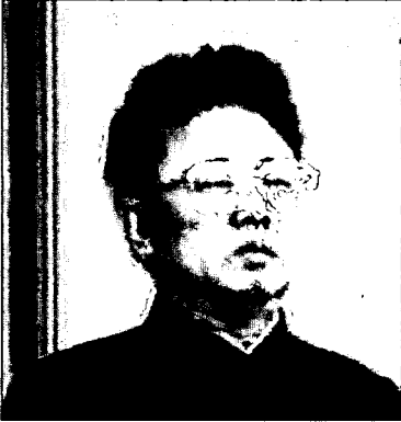
金日成主席死去3周年式典での金正日書記

そうしたなかで金正日最高司令官は、97年中にも多くの軍部隊と軍関連施設の視察を行ったり軍関係行事に出席し、軍重視の姿勢を明示した。97年中に報じられたその動静約60件中、実に8割近くが軍関連であった。