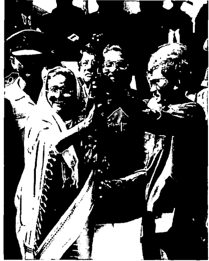
シャンティバヒニ武装解除記念式典で シェク・ハシナ首相に銃を手渡すシャ ントウ・ラルマPCJSS議長(右)

難民の帰還は1998年1月1日から始まり、2月27日に完了した。帰還難民優遇策は、過去の借金の帳消しや政府部門での優先雇用などである。また今後は、政府の開発事業、NGOの貧困者支援活動、民間企業の投資などで経済的にも潤うと期待された。シャンティバヒニの武装解除は2月10日から始まり、3月5日までには1947人が帰順した。政府はかれらに特