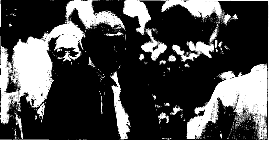
外国人記者協会主催の夕食会で回顧録の講演に向かうリー上級相夫妻

で、今回出版されたのは第1巻で、第2巻は1999年中に刊行予定。初版3万5000部は発売後2日で完売し、急遽2刷(3万5000部)が10月2日に増刷され、年末までには8万部近くが売れ、近年にないベストセラーとなった。また、一般発売に先駆けリーの署名入り特別限定版200部が1部1万$の高額で売出されたが、これもまたたくまに完売し、売上金200万$がリー・クアンユー教育基金に寄付された。回顧録は中国、香港、台湾、インドネシア、韓国、日本などアジア諸国でも発売され、マハティール首相が内容の一部を批判したマレーシアでも(後述)、2000部がすぐ売切れ7000部が直ちに追加されたという。