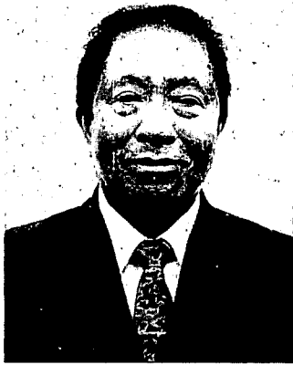
シソワト・ケオブンバン新首相 (1998年2月選出) ( Nhan Dan , 1998年7月6日)

は第5位カムタイ(当時国防相), 第8位シソワト(当時ビエンチャン市党書記), 第11位サマン(当時党組織委員会委員長)であった。つまり現在のカムタイ大統領に次ぐ地位を占めていた。ところが1991年の第5回党大会で政治局員の地位を失った。そして1996年の第6回党大会で序列第8位の政治局員として復活した。したがって現政治局内でカムタイ議長に次ぐ地位を占めてもおかしくないのである。シソワト首相が台頭し, サマン国会議長の力が弱くなった印象は否めない。